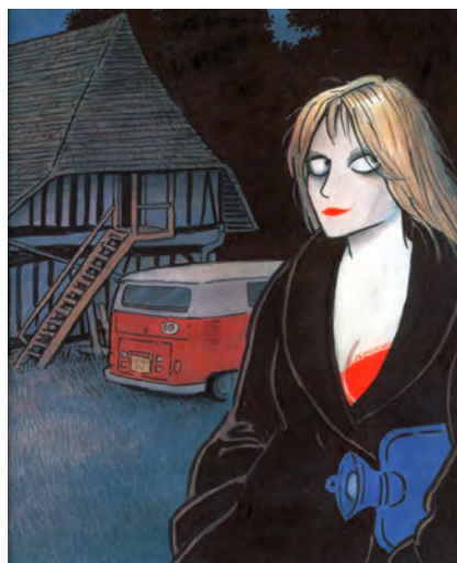
Gemma Boverly © Posy Simmonds

Posy Simmonds s'inspire des livres de l' auteur Charles Dickens pour créer cette histoire.