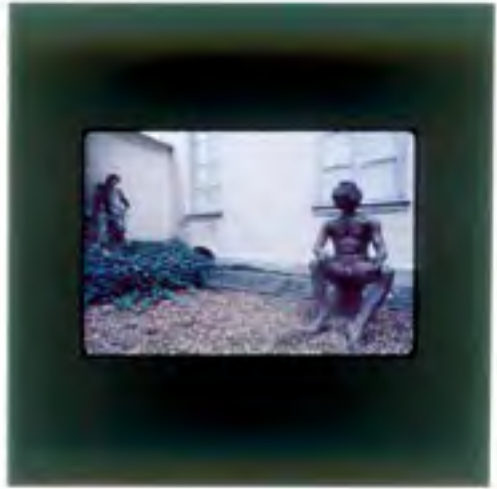
Shooting pour album L'Homme à tête de chou , © Serge Gainsbourg Maison Gainsbourg